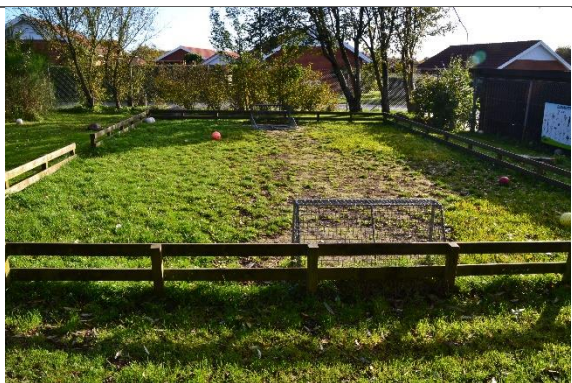
Redskab: Multibane Ikke omfattet af DS/EN 1176