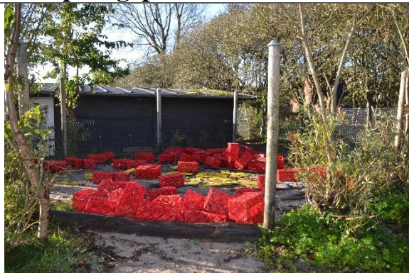
Redskab: Sandkasse med stolper til læsejl Årgang: Producent: Er redskabet mærket: Nej Er der registreret fejl/mangler: Nej