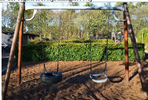
Redskab: Gyngestativ Årgang: 2008 Producent: Hags Er redskabet mærket: Ja Er der registreret fejl/mangler: Ja