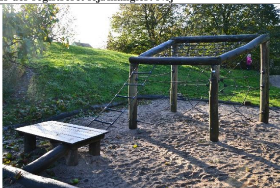
Redskab: Klatrenet Årgang: 2008 Producent: Danske Legepladser Er redskabet mærket: Ja Er der registreret fejl/mangler: Nej