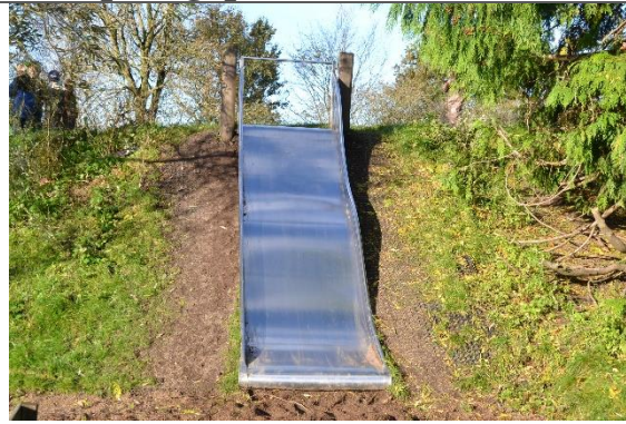
Redskab: Terrænruksjebane Årgang: Producent: Er redskabet mærket: Nej Er der registreret fejl/mangler: Nej