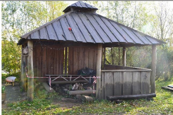
Redskab: Bålhytte Ikke omfattet af DS/EN 1176