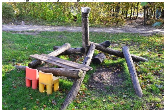
Redskab: Klatrepyramide Årgang: 1998 Producent: Norleg Er redskabet mærket: Nej Er der registreret fejl/mangler: Nej