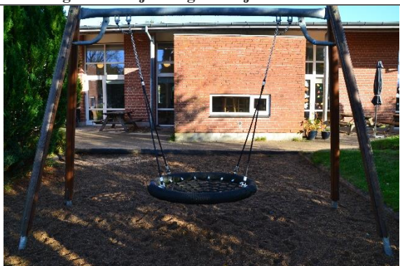
Redskab: Fugleredegynge Årgang: 2008 Producent: Hags Er redskabet mærket: Ja Er der registreret fejl/mangler: Nej