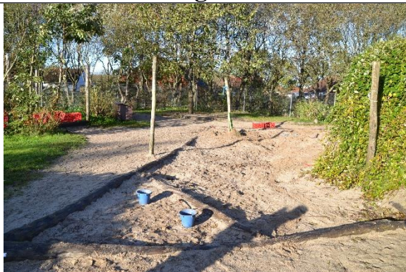
Redskab: Sandkasse med stolper til læsejl Årgang: Producent: Er redskabet mærket: Ja - ulæseligt Er der registreret fejl/mangler: Nej